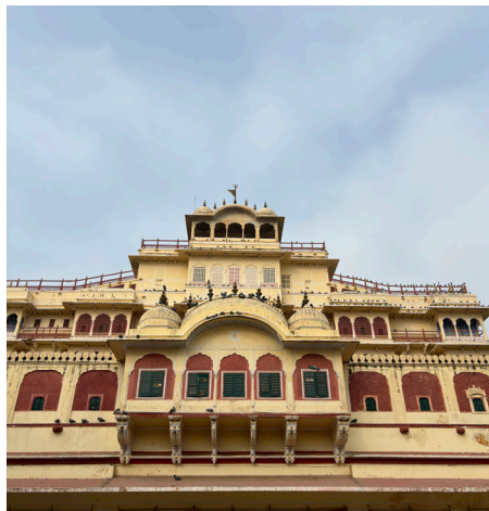
Le Palais Royal