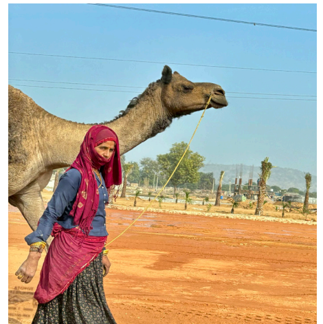
Le nomadisme, style de vie en danger