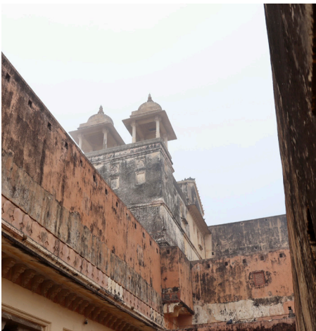
Le Fort d'Amber